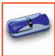
Петля Rahrbach (Германия)