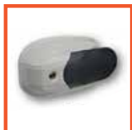
Внешняя ручка с замком Fermod (Франция)