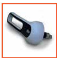
Внешняя ручка с замком Rahrbach (Германия)