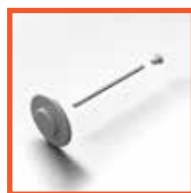
Крепеж к сэндвич панели (термогайка, теплошайба, шпилька, гайка Эриксона)