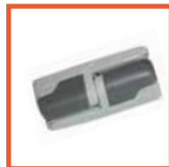
Петля Fermod (Франция)