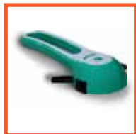
Внутренняя ручка Rahrbach (Германия)