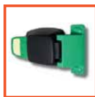
Внутренняя ручка Fermod (Франция)