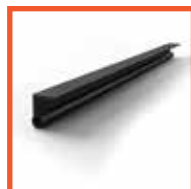
Уплотнитель нижний для беспороговых дверей