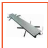
Порог утепленный нержавеющей