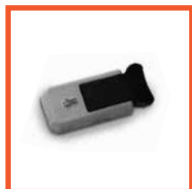
Внешняя ручка с замком МТН (Италия)