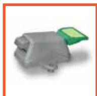
Внутренняя ручка МТН (Италия)