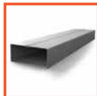
Обрамление светового проема